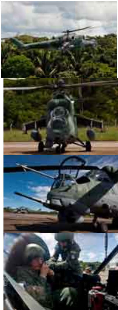
Novos helicópteros de ataque são apresentados em Porto Velho

Tuesday, 20 April 2010 15:04 - Last Updated Tuesday, 20 April 2010 17:11